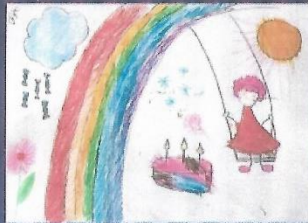
Название работы: «Радужные сны»