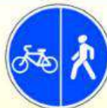
4.5.4. «Пешеходная и велосипедная дорожки с разделением движения»