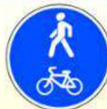
4.5.2. «Пешеходная и велосипедная дорожка с совмещённым движением (велопешеходная дорожка с совмещённым движением)»