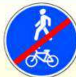
4.5.3. «Конец пешеходной и велосипедной дорожки с совмещённым движением»