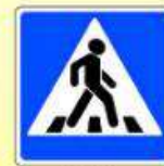
5.19.1. «Пешеходный переход»