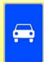
5.3 «Дорога для автомобилей»