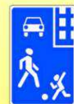
5.21 «Жилая зона»