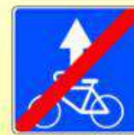
5.14.3. «Конец полосы для велосипедистов»