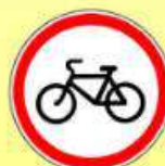
3.9 «Движение на велосипедах запрещено»