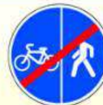
4.5.6. «Конец пешеходной и велосипедной дорожки с разделением движения (конец велопешеходной дорожки с разделением движения)»