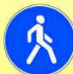
4.5.1 «Пешеходная дорожка»