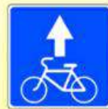
5.14.2. «Полоса для велосипедистов»