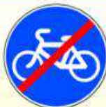
4.4.2. «Конец велосипедной дорожки или полосы для велосипедистов»